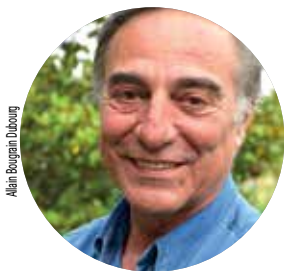
Allain Bougrain Dubourg