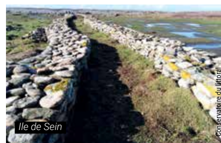
Île de Sein

Mairie de l'île de Sein : Tél. : 02 98 70 90 35 Email : mairie.ile.de.sein@orange.fr