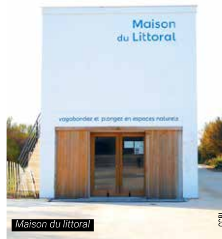
Maison du littoral

https://www.ccbi.fr/poin-te-des-poulains-la-maison-du-littoral/