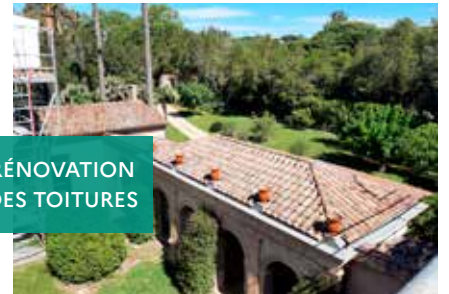
RÉNOVATION DES TOITURES

Finalisation des travaux de rénovation des toitures sous maîtrise d'ouvrage déléguée à la commune de Saint-Tropez. Ouverture du parc du château au public pendant l'été.