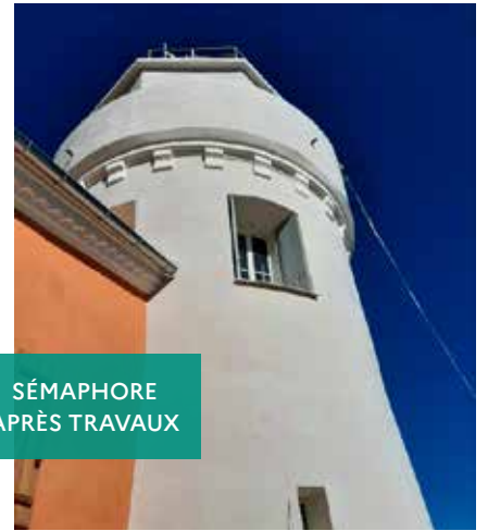
SÉMAPHORE APRÈS TRAVAUX