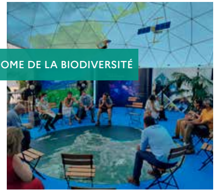
DOMES DE LA BIODIVERSITÉ

Afin de mieux partager les objectifs des plans de gestion avec les partenaires et usagers des sites, le Conservatoire du littoral édite des plaquettes de synthèse des projets de site. En 2021 a ainsi été réalisée la synthèse du plan de gestion multi-sites du mas de la Cure, mas du Taxil et Grandes Cabanes (Camargue). Une synthèse de l'étude sur les retombées économiques de la gestion des marais du Vigueirat a également été publiée.