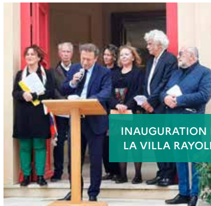
INAUGURATION DE LA VILLA RAYOLET

Finalisation de la restauration de la Villa Rayolet, inscrite aux Monuments historiques, et installation d'une exposition permanente sur l'histoire du site et de ses jardins dans les 3 salles qui seront ouvertes au public à partir de 2022.