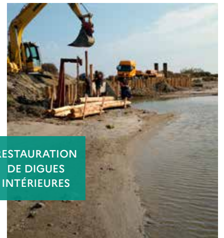
RESTAURATION DE DIGUES INTÉRIEURES

Restauration de digues intérieures et de passerelles pour l'accès piétons et cycles au public.