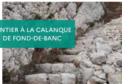
SENTIER À LA CALANQUE DE FOND-DE-BANC

Vigueirat pour la pose de clôtures à taureaux et du débroussaillage sur l'étang du Bolmon, en complément des travaux réalisés directement sur le site des marais du Vigueirat (arrachage de jussies, nettoyage du canal du Vigueirat et pose d'un platelage). Plusieurs autres chantiers de jeunes ou chantiers d'insertion se déroulent sur les sites du Conservatoire, pilotés directement par les gestionnaires de sites.