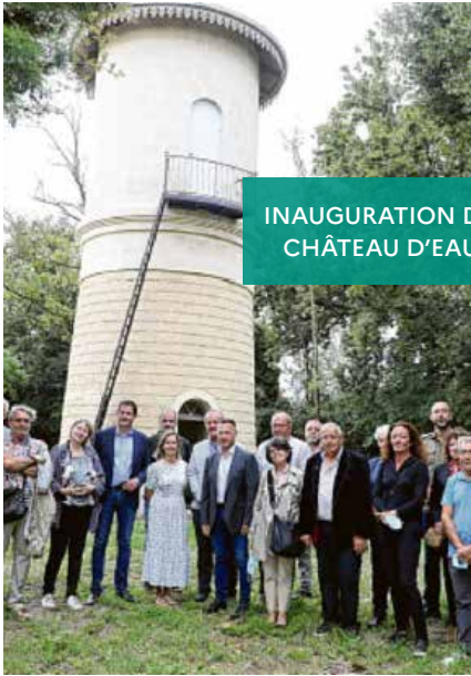
INAUGURATION DU CHÂTEAU D'EAU

Inauguration de la restauration du château d'eau (forte valeur patrimoniale) et de l'ancien cochonnier attenant au corps de bâtiment. Restauration des immenses toitures du bâtiment dit de la Cave.