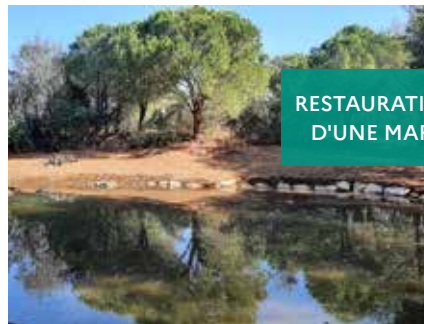
RESTAURATION D'UNE MARE

Restauration d'une mare par le Parc national de Port Cros.