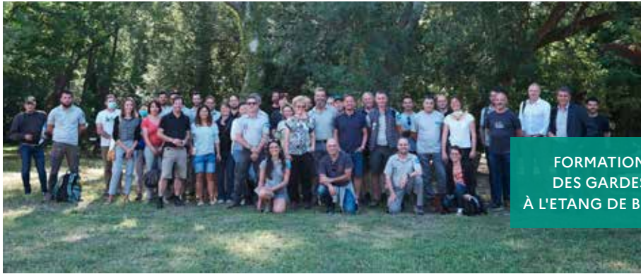
FORMATION DES GARDES À L'ÉTANG DE BERRE