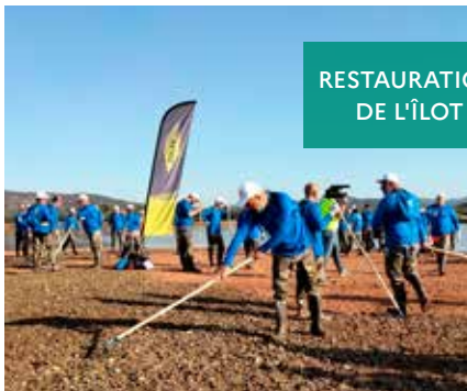
RESTAURATION DE L'ÎLOT

Restauration d'un îlot à oiseaux larolimicoles dans le cadre d'un mécénat de compétence de l'entreprise Colas.