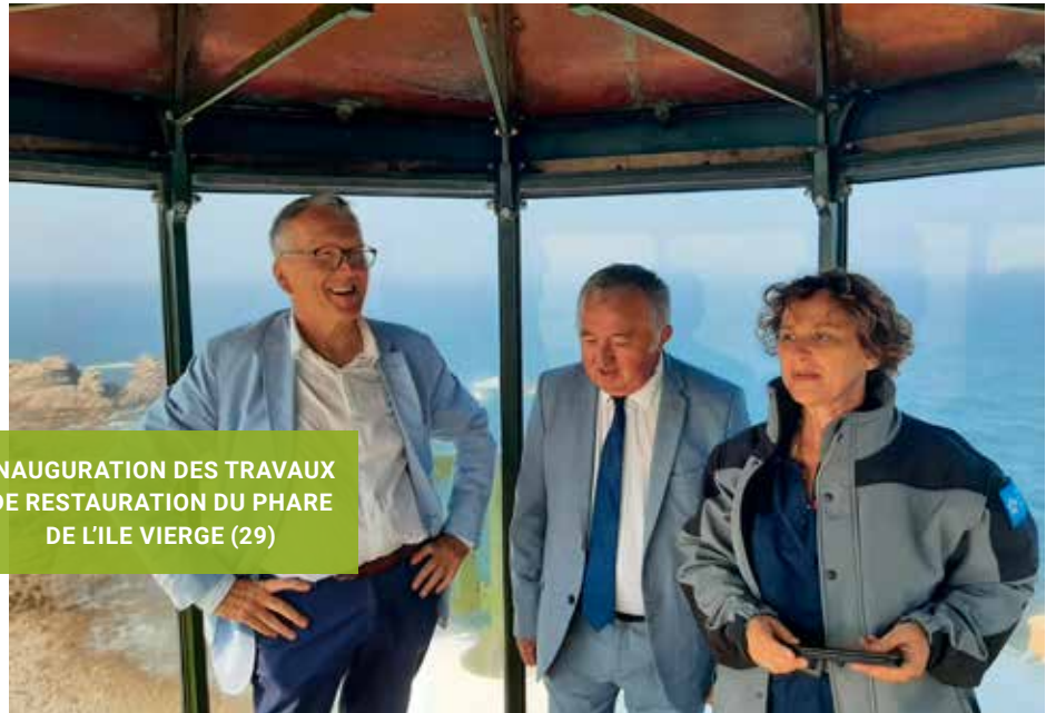
INAUGURATION DES TRAVAUX DE RESTAURATION DU PHARE DE L'ÎLE VIERGE (29)

Les travaux de restauration du phare de l'île Vierge, débutés en septembre 2018 ont duré près de 3 ans dans des conditions souvent difficiles en raison des marées et des aléas de la météo et de la crise sanitaire. La maîtrise d'ouvrage des travaux a été assurée par la Communauté de communes du Pays des Abers.