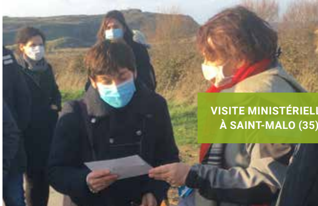
VISITE MINISTÉRIELLE À SAINT-MALO (35)