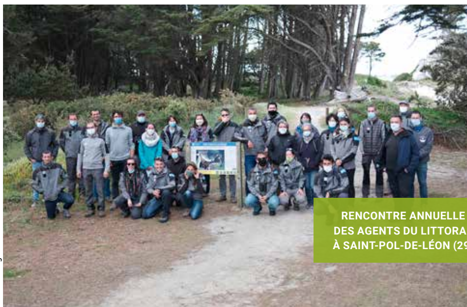
RENCONTRE ANNUELLE DES AGENTS DU LITTORAL À SAINT-POL-DE-LÉON (29)