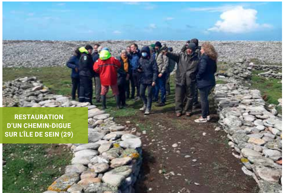
RESTAURATION D'UN CHEMIN-DIGUE SUR L'ÎLE DE SEIN (29)

En partenariat avec EDF et la mairie de Sein, le Parc naturel régional d'Armorique (PNRA) et le Conservatoire du littoral ont réalisé une opération de restauration d'un chemin-digue en pierres sèches sur l'île de Sein afin de créer un sentier sur le secteur nord de l'île et d'offrir ainsi aux visiteurs une balade riche en découvertes.