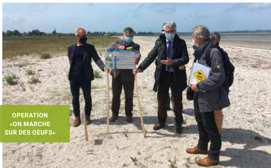
OPERATION «ON MARCHÉ SUR DES ŒUFS»

La sous-préfecture, le Conservatoire du littoral, l'Office français de la biodiversité, les collectivités locales et les associations environnementales se mobilisent pour protéger les oiseaux de bord de mer dans la baie du Mont-Saint-Michel. L'opération a été lancée à Hirel.