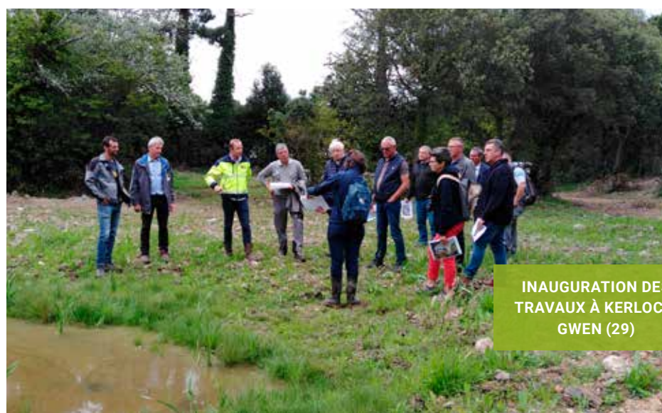
INAUGURATION DES TRAVAUX À KERLOC'H GWEN (29)