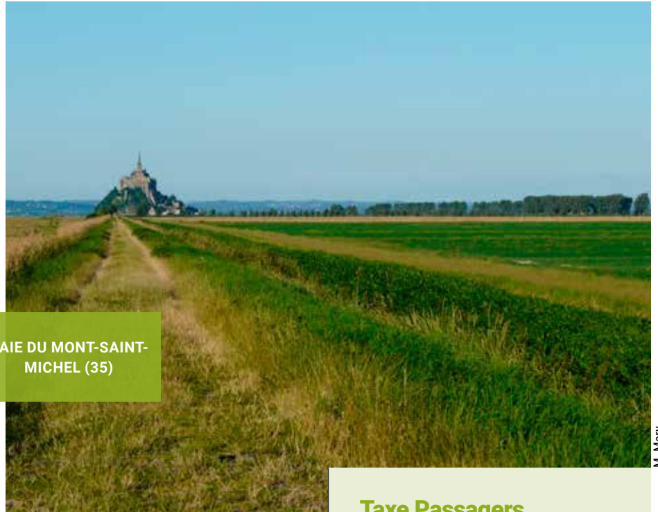
BAIE DU MONT-SAINT-MICHEL (35)