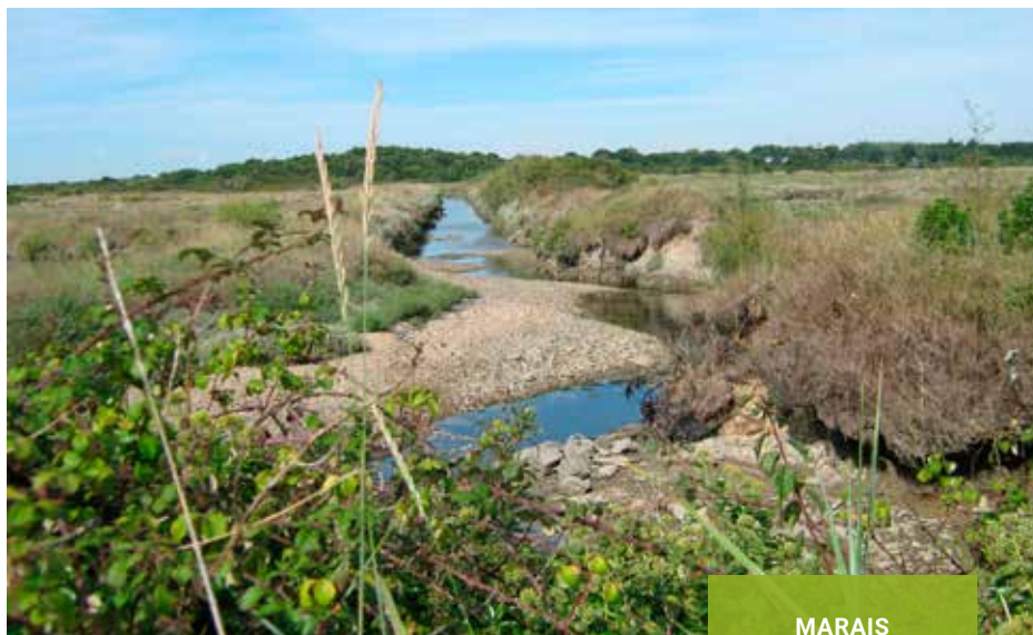
MARAI SAINT-ELOI (56)

Le Conservatoire du littoral poursuit activement, en concertation avec les collectivités locales, sa politique foncière en vue de la sauvegarde des sites, des paysages et des milieux naturels littoraux. Au 31 décembre 2021, il aura acquis en Bretagne près de 12 000 ha (dont 2140 ha sur le domaine public maritime) répartis sur les 148 périmètres d'intervention, représentant environ un tiers des superficies totales des sites validés (29 500 ha).