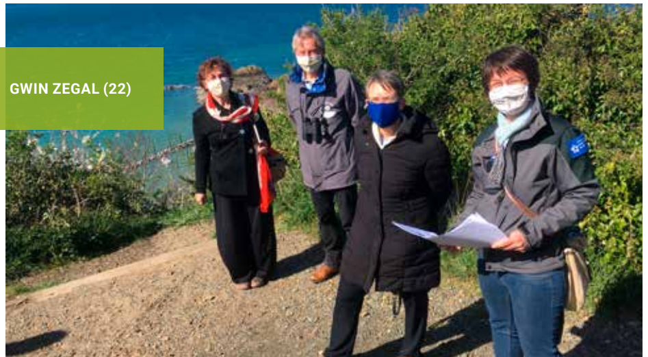
GWIN ZEGAL (22)

La directrice du Conservatoire est venue rencontrer l'équipe de la délégation Bretagne et visiter plusieurs sites : Sillon de Talbert, Gwin Zegal, Fréhel et Lancieux. A cette occasion elle a lancé officiellement le guide la Bretagne entre Terre & Mer . Belles Balades éditions et le Conservatoire du littoral ont, en effet, publié un guide comprenant 32 balades sur les plus beaux rivages de la Bretagne préservés par le Conservatoire du littoral.