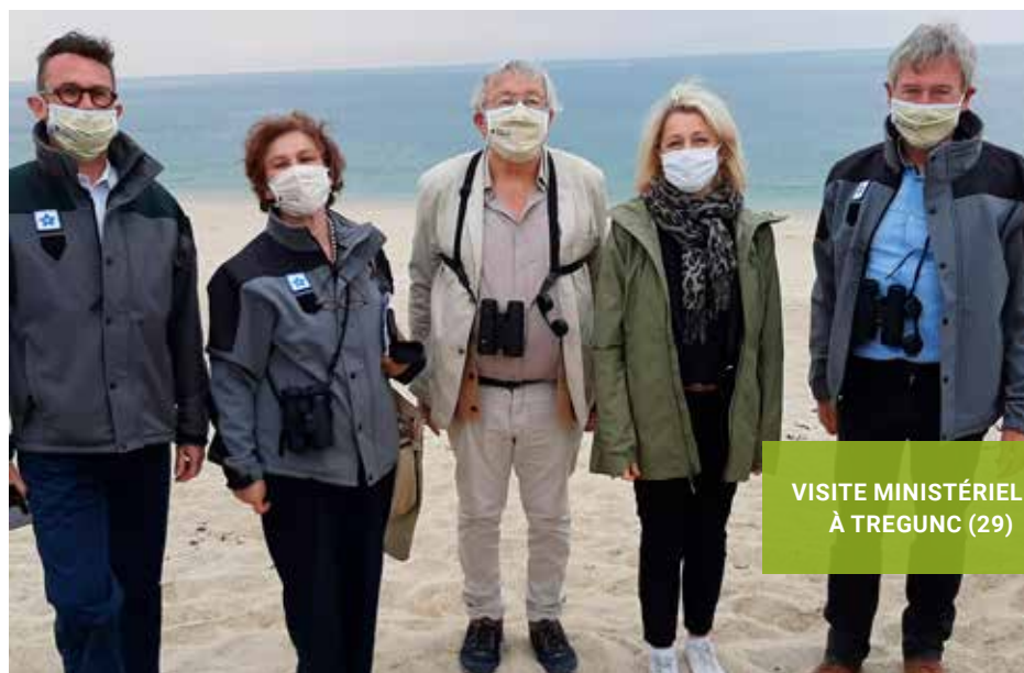
VISITE MINISTÉRIELLE À TREGUNC (29)