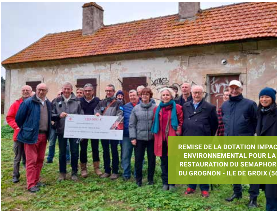
REMISE DE LA DOTATION IMPACT ENVIRONNEMENTAL POUR LA RESTAURATION DU SEMAPHORE DU GROGNON - ILE DE GROIX (56)