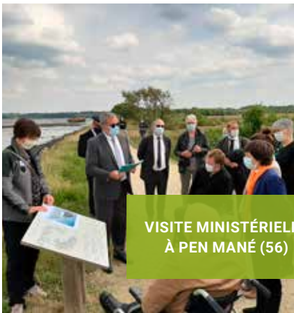
VISITE MINISTÉRIELLE À PEN MANÉ (56)