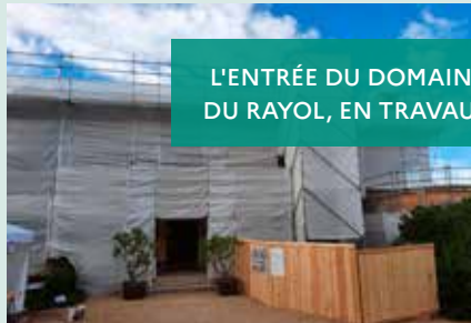
L'ENTRÉE DU DOMAINE DU RAYOL, EN TRAVAUX