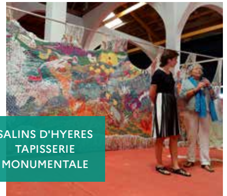
SALINS D'HYERES TAPISSERIE MONUMENTALE

DÉLÉGATION PROVENCE-ALPES-CÔTE D'AZUR Bastide Beaumanoir • 3, rue Marcel Arnaud - 13 100 Aix-en-Provence Tél : 04 42 91 64 10 mail : paca@conservatoire-du-littoral.fr