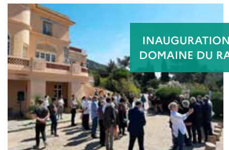
INAUGURATION AU DOMAINE DU RAYOL

Refonte complète par l'association gestionnaire de la salle introductive au Domaine du Rayol, avec un film de Gilles Clément présentant les concepts clés du jardin.