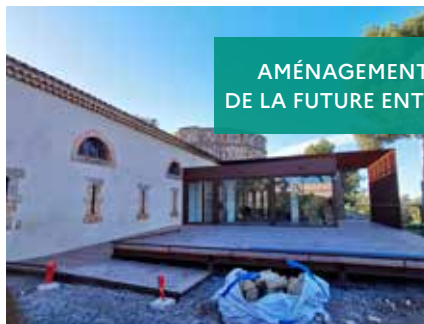
AMÉNAGEMENT DE LA FUTURE ENTRÉE

Importants travaux d'aménagement de l'Espace Mer et littoral menés par la Ville d'Antibes dans la perspective d'une réouverture en 2023.