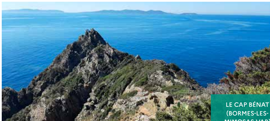
LE CAP BÉNAT (BORMES-LES-MIMOSAS-VAR)

Mettre en œuvre la stratégie d'intervention foncière 2015-2050