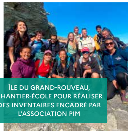
ÎLE DU GRAND-ROUVEAU, CHANTIER-ÉCOLE POUR RÉALISER DES INVENTAIRES ENCADRÉ PAR L'ASSOCIATION PIM

Au Domaine de la Palissade, renouvellement de la muséographie de la salle d'interprétation par le Parc Naturel Régional de Camargue.