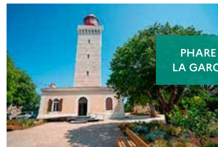
PHARE DE LA GAROUBE

Certains sites accueillent une programmation culturelle variée, convaincus du fort intérêt de tisser des liens entre Nature et Culture. Ces échanges avec le monde artistique ont été amplifiés depuis 2022 grâce au plan de relance du Ministère de la Culture « Mondes nouveaux », qui a permis à de jeunes créateurs d'investir des sites pour présenter leurs œuvres. En 2023, un photographe a partagé son regard sur la Camargue contemporaine, un sculpteur a exposé des œuvres rendant hommage à l'histoire ouvrière de la Poudrière Royale, et une designer a créé des mobiliers de plein air en liège faisant écho à la Villa E1027 d'Eileen Gray.