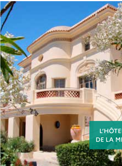
L'HÔTEL DE LA MER

Restauration extérieure de l'ancienne chapelle du Mas de la Cure, porte d'entrée du Domaine et futur centre d'interprétation du cheval Camargue, en intégrant les aménagements spécifiques pour préserver l'importante colonie de chauve-souris découverte lors des études préalables. L'accompagnement naturaliste en phase chantier se poursuivra pour la suite des travaux, afin de suivre l'évolution de la colonie.