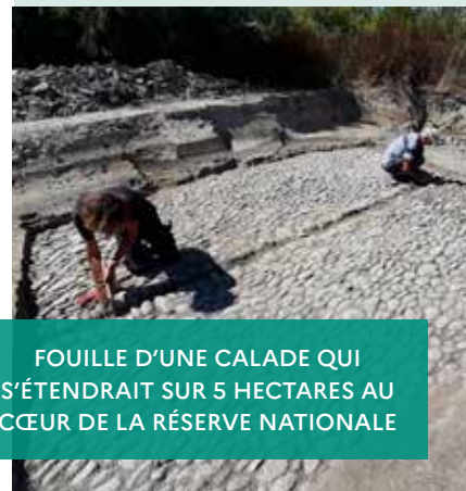
FOUILLE D'UNE CALADE QUI S'ÉTENDRAIT SUR 5 HECTARES AU CŒUR DE LA RÉSERVE NATIONALE