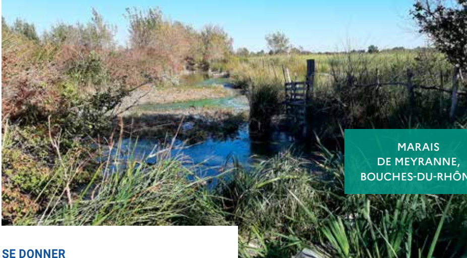
MARAI DE MEYRANNE, BOUCHES-DU-RHÔNE

Mettre en œuvre la stratégie d'intervention foncière 2015-2050