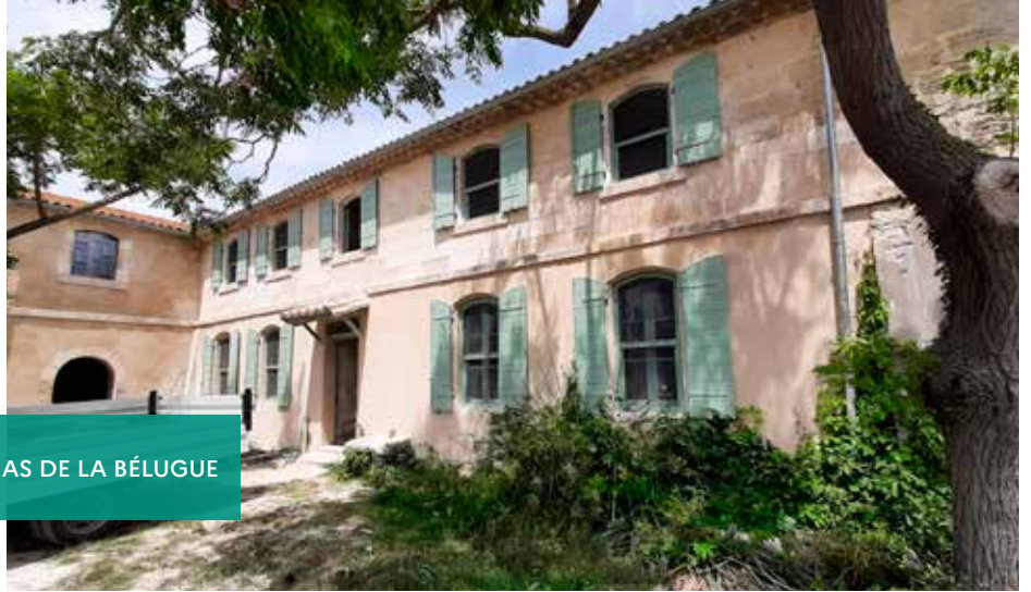
MAS DE LA BÉLUGUE