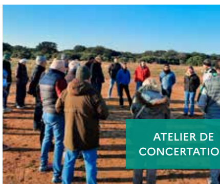
ATELIER DE CONCERTATION

La gestion des espaces naturels acquis par le Conservatoire du littoral est confiée par convention aux collectivités locales, à des établissements publics, des fondations ou des associations. Ces gestionnaires bénéficient d'un soutien financier grâce aux conventions tripartites Département/Région/Conservatoire pour la gestion des sites. Ces conventions favorisent une véritable dynamique autour d'une gouvernance partenariale spécifique : comité départemental et comités locaux de gestion rassemblant les équipes gestionnaires, les élus et les représentants d'usagers de chacun des sites. Pour faire face à la forte augmentation des superficies protégées, la convention tripartite des Bouches-du-Rhône a été renouvelée pour la période 2023-2027, pour un montant réévalué à 630 000 € annuels au bénéfice des gestionnaires des sites.